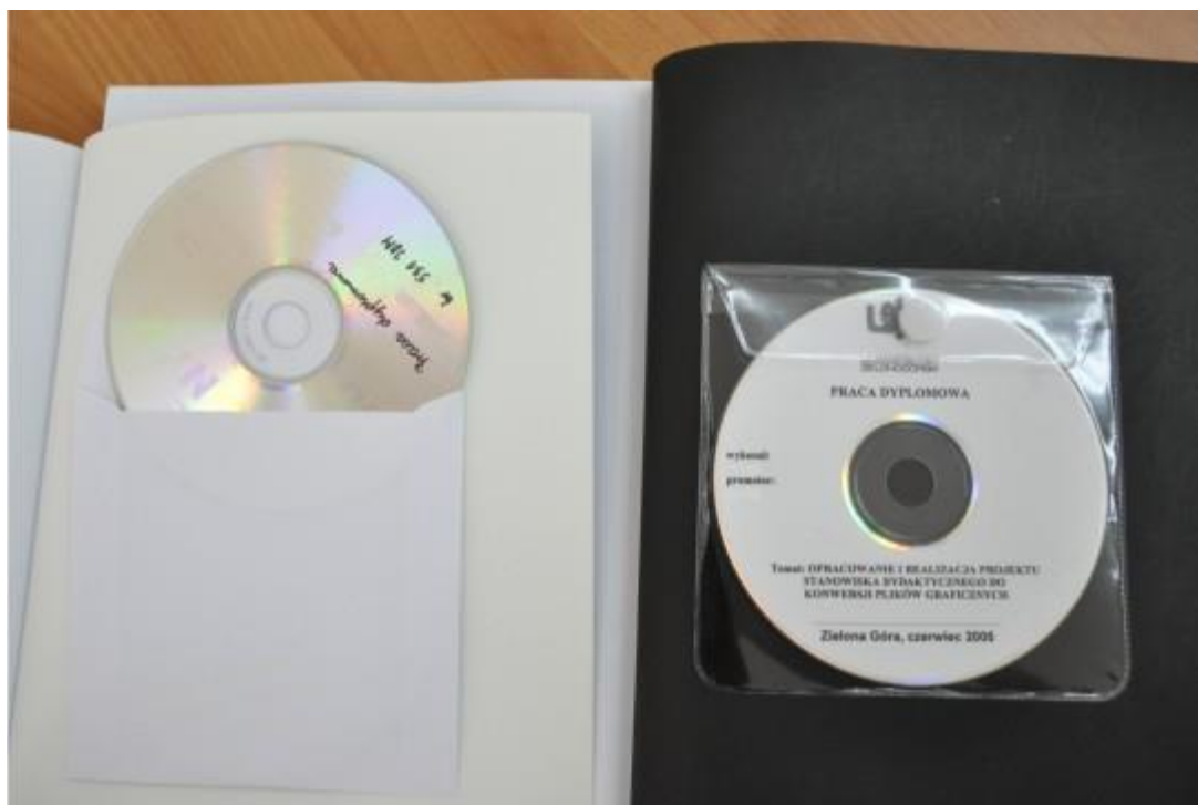
Rysunek 2. Zalecana forma umocowania płyt CD/DVD – przykłady.